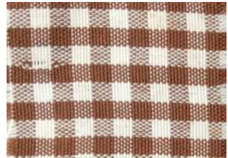
Figure 2: Shamba dress(gauni refu)