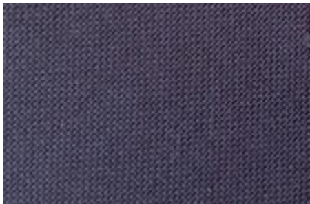
Figure 1: Sketi na Sweta (kijivu)