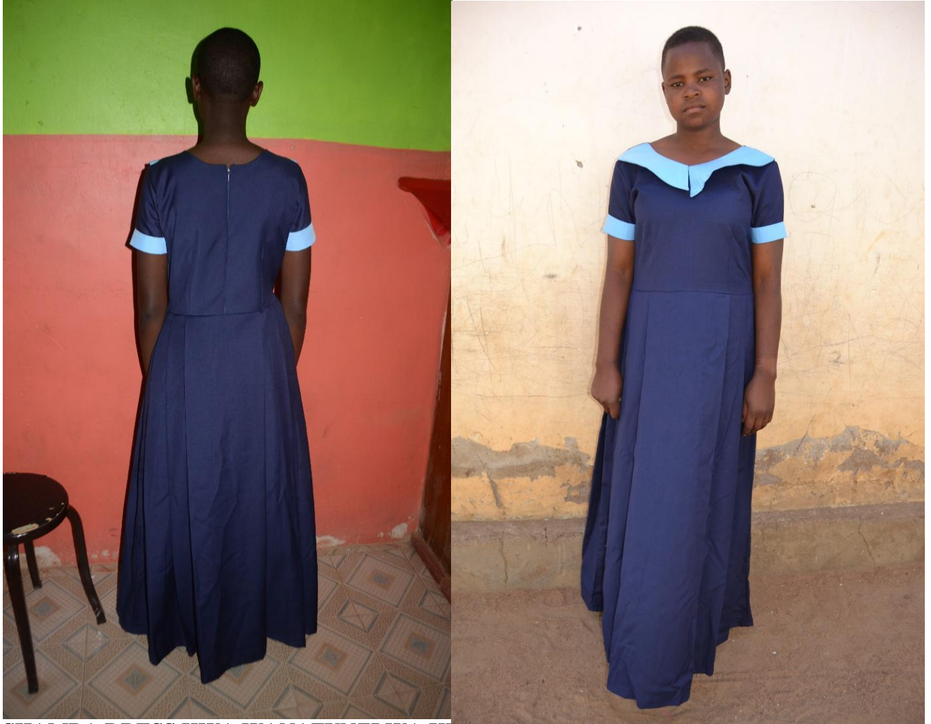
SHAMBA DRESS KWA WANAFUNZI WA KIKRISTO. KWA WANAFUNZI WA KIISLAMU NI GAUNI HII HII, ILA IWE YA MIKONO MIREFU YENYE BINDING YA LIGHT BLUE, PIA