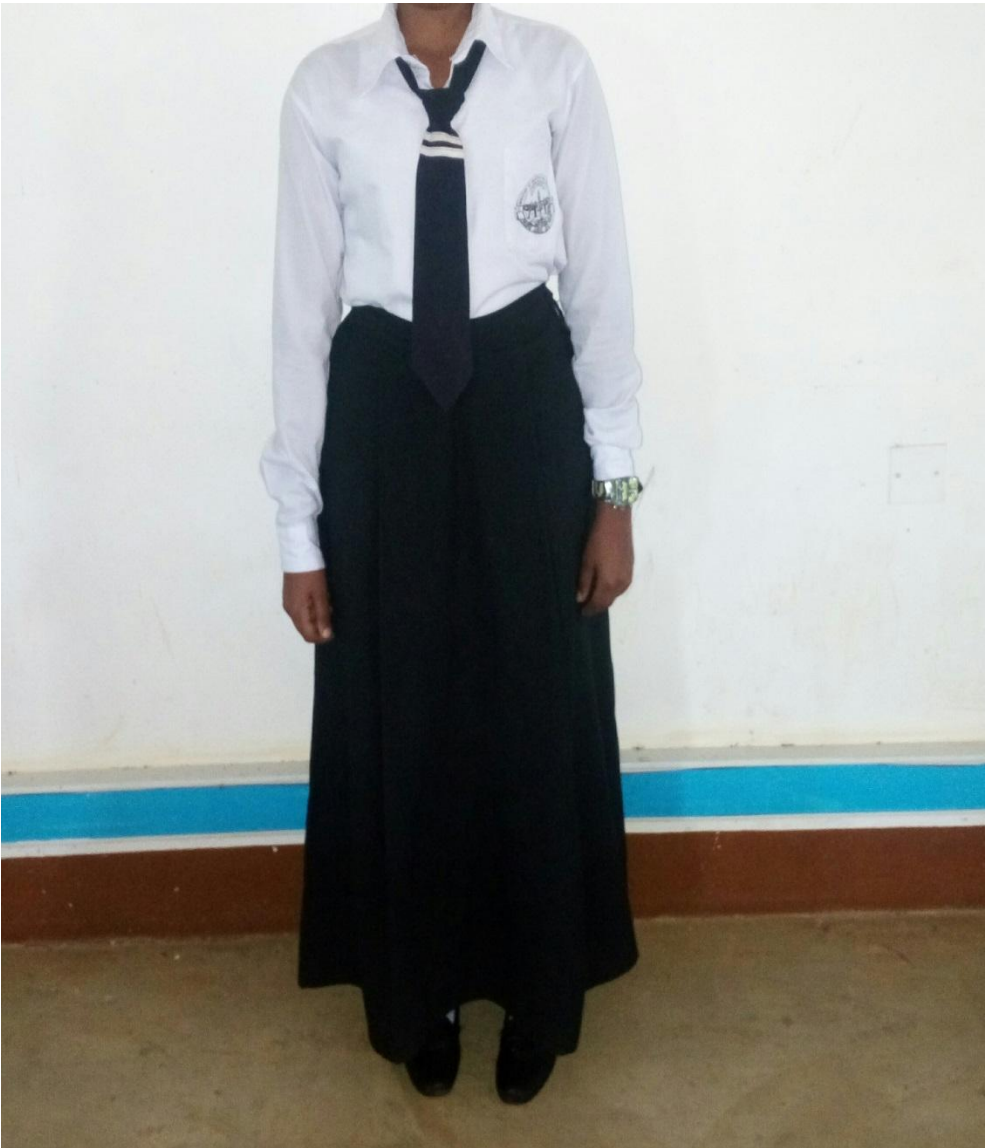
SARE YA DARASANI KWA WANAFUNZI WA KIKRISTO