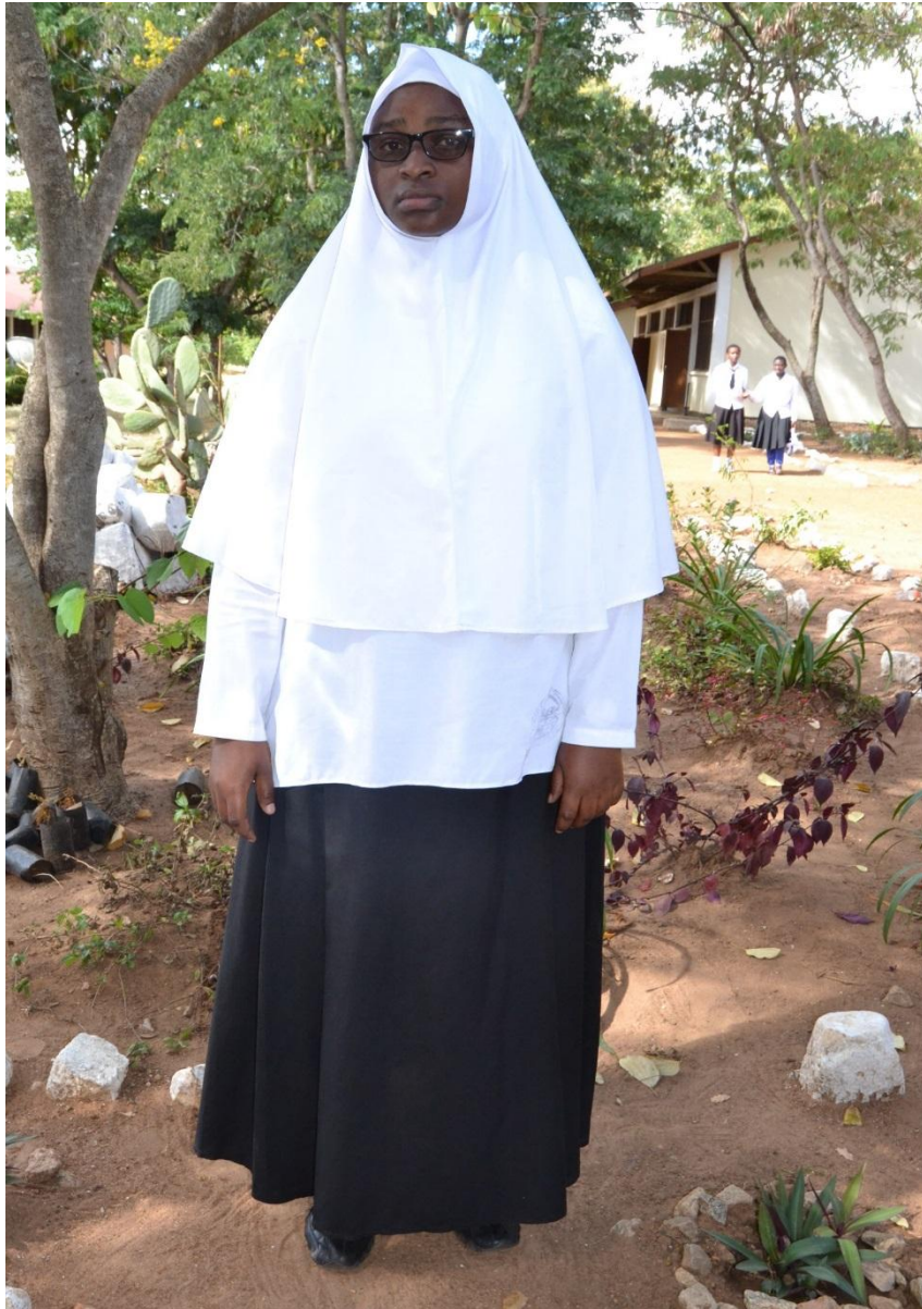
SARE YA DARASANIO KWA WANAFUNZI WA KIISLAMU