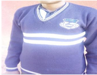
Mbele iwe hivi