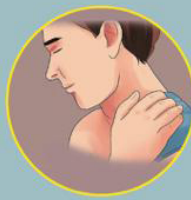
Maumivu ya Misuli