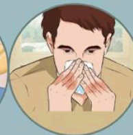
Funika mdomo na pua