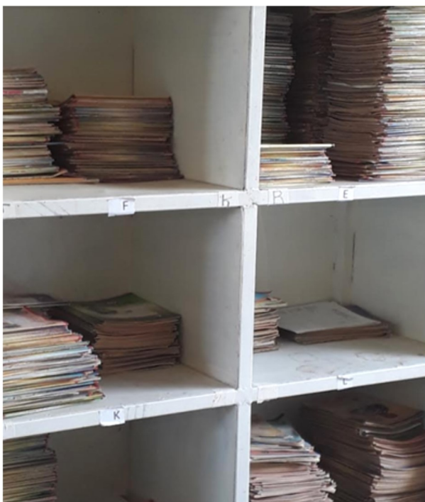
Picha ikionesha uwekaji wa awali wa majalada ya wagonjwa katika Kituo cha Afya Dinyeche

“Mbali na kwamba kuna uhahaba wa watumishi kituoni, mfumo unatuwezesha kusimamia kazi kwa kiwango kikubwa na kwa kushirikiana na Maafisa kutoka TAMISEMI na Mradi wa PS3 hapa Mara ambao hufika mara kwa mara kwaajili ya kujenga uwezo kwa watumishi wavya ambao hufika kutekeleza majukumu hapa Nyamongo”, anaongeza Dr. Rasuli.