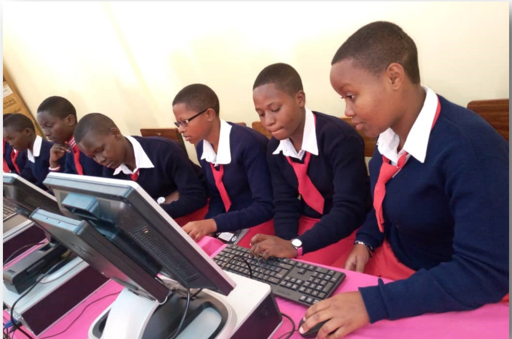
Wanafunzi wa Shule ya Wasichana Kondo wakifuatilia kwa umakini somo la mifumo katika chumba cha mifumo shuleni hapo

shule Mwalimu Mustafa Nkondokaya anaongeza kuwa kwake mfumo huo umekuwa ni msaada mkubwa sana kwani amekuwa akiandaa taarifa ya fedha kwa umakini na uhakika zaidi tofauti na awali ambapo taarifa zilikuwa zinatofautiana wakati wa uandaaji.