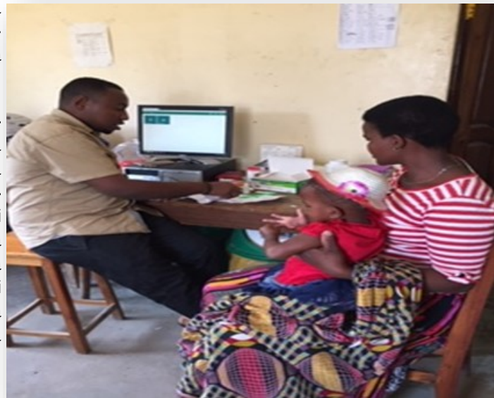
Mhudumu wa Maabara akitoa huduma kwa mkazi wa Nyamongo kwa kutumia mfumo wa GoTHOMIS katika Kituo cha Afya Nyamongo