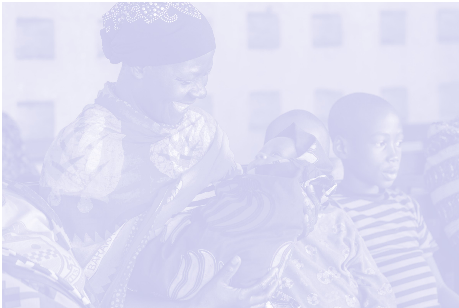
Mkazi wa Halmashauri ya Wilaya ya Kasulu Mkoani Kigoma akiwa katika Zahanati ya Nyakitondo akisubiri huduma kutoka kwa wauguzi