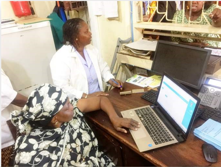
Wauguzi katika moja ya hospitali nchini wakitoa huduma kwa wananchi kwa kutumia mfumo wa kieletroniki wa GoTHOMIS

Kitali anaongeza kuwa mwanachi wa kawaidia anataka kujua nini kimepangwa, bajeti zikoje, matumizi yamefanyikaje, kwa hiyo kama mwanachi na wadau wengine wanafuatilia kujua na kufahamu kinachoendelea, wataweza kupata taarifa hizo kupitia dashibodi iliyopo katika Muongano Gateway inayomwezesha kupata taarifa zinazohitajika kwa wakati na uwazi.