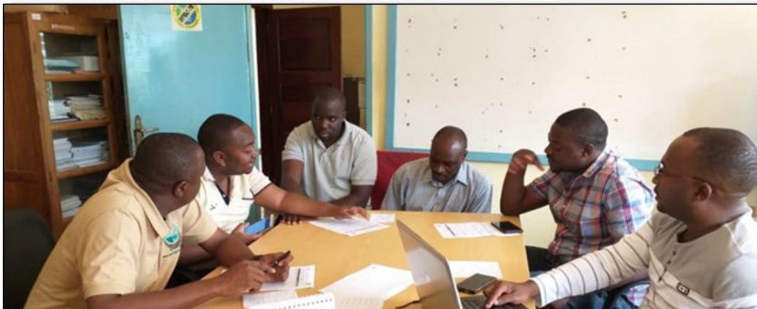
Wakufunzi wa Kitaifa wa PlanRep kutoka Ofisi ya Rais TAMISEMI na PS3 wakitoa maelekezo kwa baadhi ya maafisa wa Manispaa ya Kigoma Ujiji wakati wa mafunzo elekezi ya mfumo wa PlanRep.