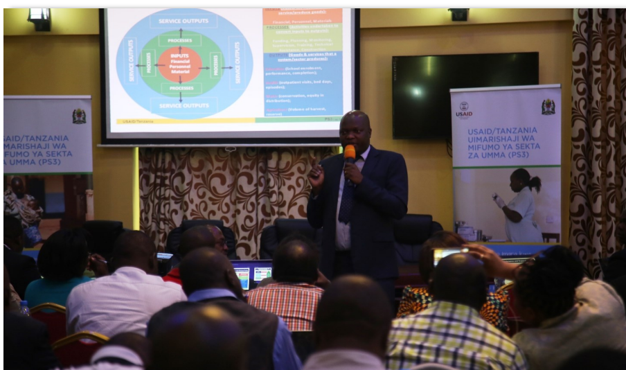
Kiongozi wa Timu ya Mifumo ya Fedha kutoka Mradi wa PS3 akitoa mafunzo ya PlanRep iliyoboreshwa kwa Maafisa Mipango, Waganga Wakuu, wahasibu pamoja na maafisa TEHAMA kutoka Mikoa ya Mbeya na Rukwa Mkoani Mbeya

Anaendelea kusema kuwa, fedha zinazotokana na matibabu ya wanachama wa bima za afya nchini, ambazo ni za Mfuko wa Taifa wa Bima ya Afya (NHIF) na Mfuko wa Afya wa Jamii (CHF), zinalipwa moja kwa moja kwenye akaunti za benki za vituo husika. Fedha hizi zinatumiwa na kusimamiwa kupitia mfumo wa ‘FFARS’, ambao ni mfumo wa Kihisibu na Utoaji wa Taarifa za Fedha kwenye