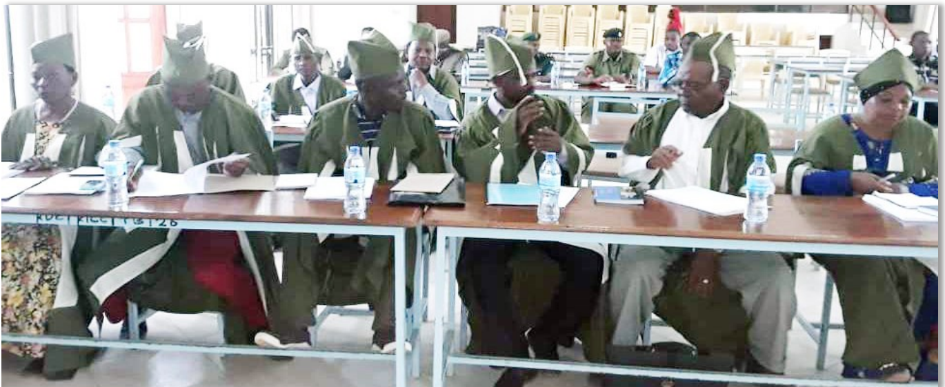
Madiwani wa Halmashauri ya Mji wa Kondoa wakiwa katika kikao cha kupitisha Randama ya Bajeti kwa Mwaka wa Fedha wa 2019/20 katika ukumbi wa Halmashauri hiyo

Anaongeza kuwa kuna fomu namba 9 ambayo ni Tange ya watumishi ambayo inatoa taarifa ya miaka mitatu mbele ukijaza inajaza mpaka mwisho na fomu F ya wastaafu ambayo ukijaza utaona wastaafu kwa mwaka unaokuja ni wangapi na mishahara yao itakuwa ni shilingi ngapi hivyo mfumo huo umeboresha na kuimarisha shughuli ya kuandaa bajeti ya mishahara.